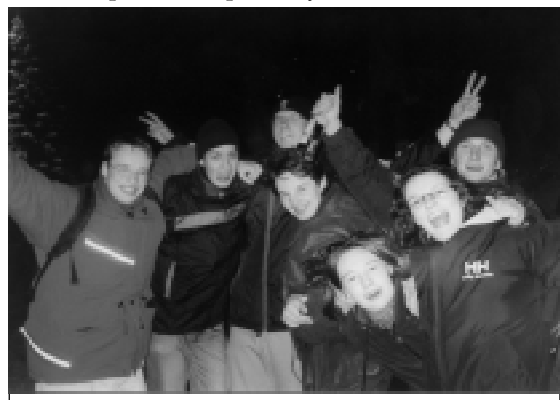
Studenti oslavují příchod nového roku

Blížila se desátá hodina a někteří už začali ze zimy poskakovat, aby do půlnoci nezmrzli.