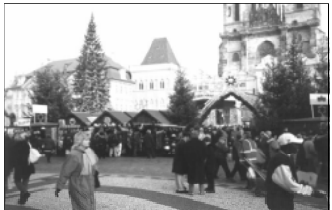
Vánoční trhy na Staroměstském náměstí (Praha, 2000)