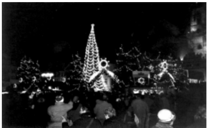
Vánoční trhy večer (Praha, 2000)