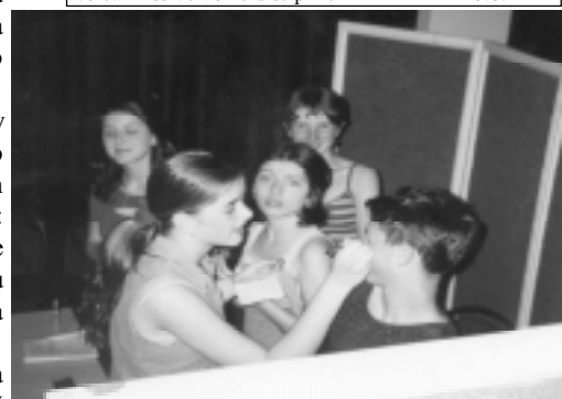
Přípravy soutěžících v zúkulisi byly obrovské