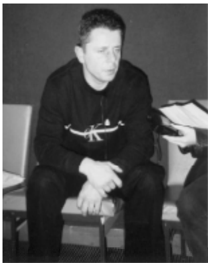
Zamyšlený Petr Muk