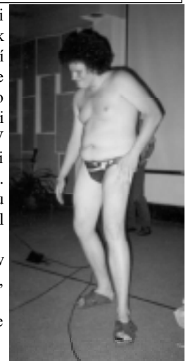
Hřeb dopoledne. Mannheim