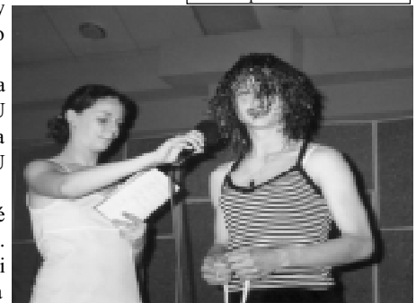
Volba Miss ve volné disciplíně